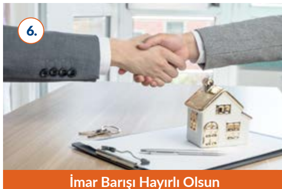
6. İmar Barışı Hayırlı Olsun