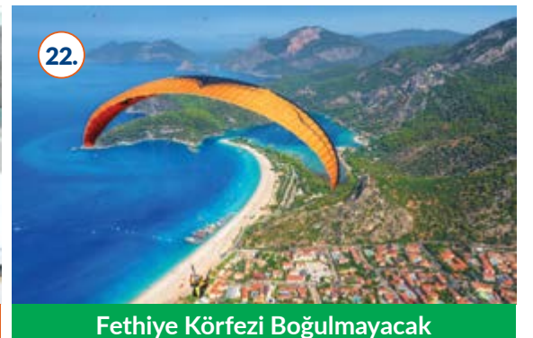
22. Fethiye Körfezi Boğulmayacak