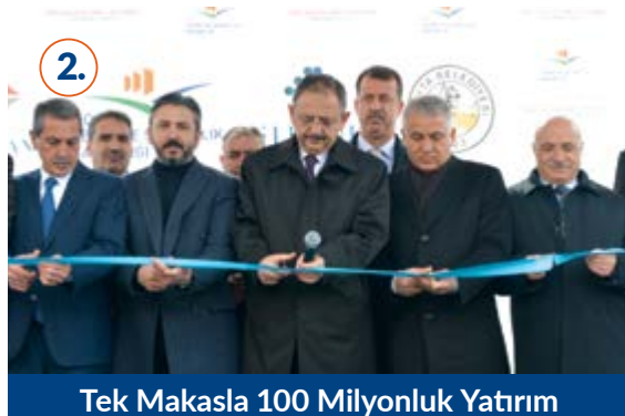
2. Tek Makasla 100 Milyonluk Yatırım