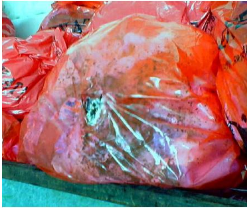
Tıbbi Atıkların Etrafa Yayılması