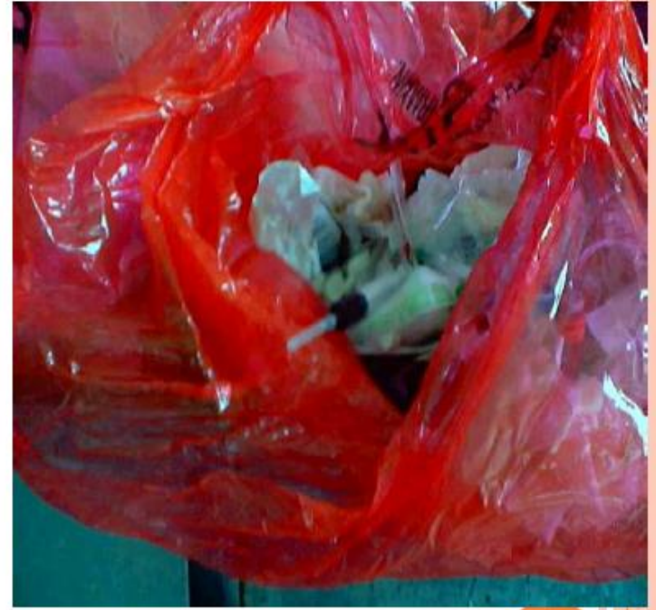
Tıbbi Atıkların Diğer Atıklarla karıştırılması