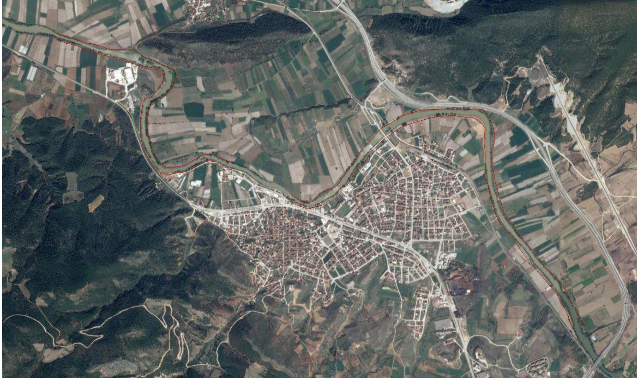
OSMANELİ İLÇESİ SAKARYA NEHRİ KIYI KENAR ÇİZGİSİ TESPİT ÇALIŞMASI