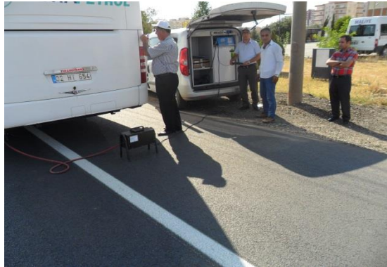
EGZOZ GAZI (EMİSYON)