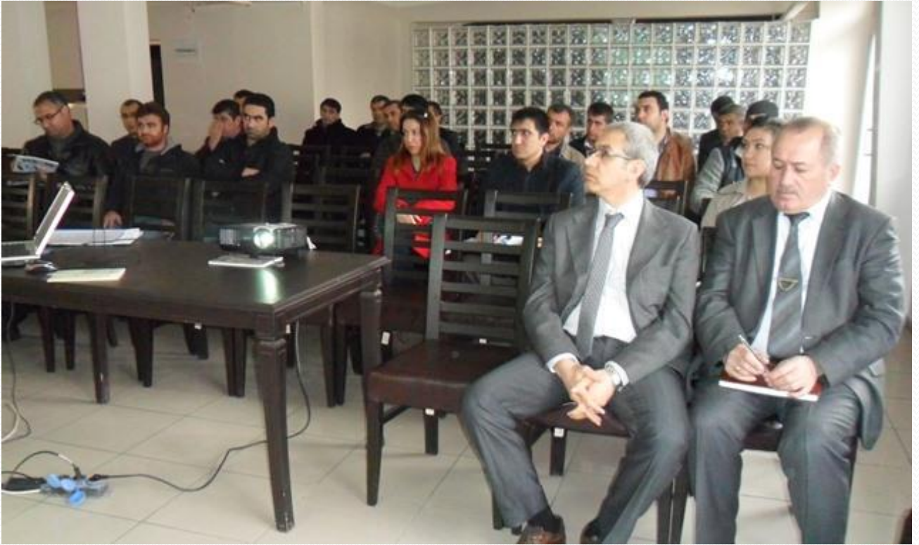
Maden Sektörüne Yeni Çed Yönetmeliği Eğitimi

Müdürlüğümüz tarafından 2017 yıllarında ÇED Yönetmeliği Uygulamaları, ve Çevre İzni kapsamında Eğitimler düzenlenerek Kurum-Kuruluşlar ve Sektör yetkilileri bilgilendirilmiştir.